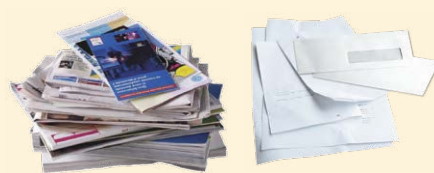
Journaux, publicités, enveloppes...