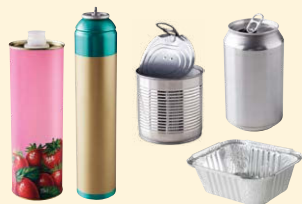
Bouteilles • Aérosols alimentaires / d'hygiène • Conserves • Canettes