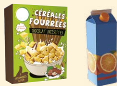
Cartonnettes • Briques alimentaires