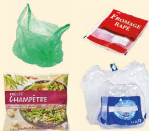
Sacs, sachets, films