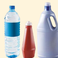
Bouteilles & flacons